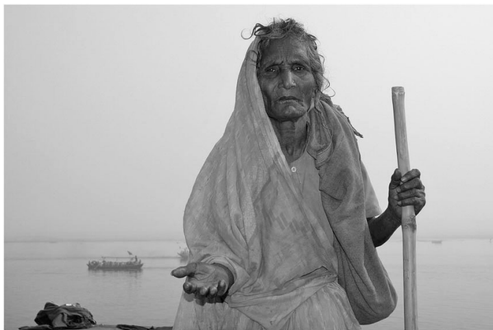
60% der Einwohner von Uttar Pradesh leben unterhalb der Armutsgrenze

dem frustriert über zögerliche Reformen, Korruptionsskandale, wuchernde Bürokratie und eine miserable Infrastruktur.“ (NZZ am Sonntag, 23.6.2013)